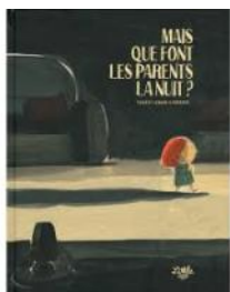
Mais que font les parents la nuit ? Lenain Thierry