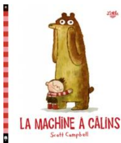
La machine à câlins Campbell Scott

Une sélection d'ouvrages à découvrir pour les enfants de 0 à 10 ans !