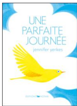
Une parfaite journée Yerkes Jennifer