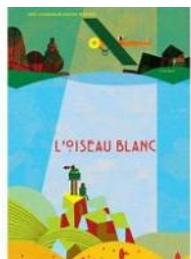
L'oiseau blanc Cousseau Alex